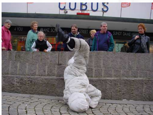
2000/10/10-11 挪威 卑爾根城