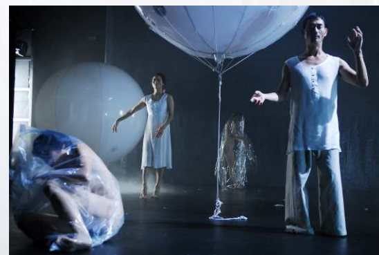
《呼吸(二) - 現象》劇照 2007/07/27-29: 香港 牛池灣文娛中心劇院 2008/06/25-27: 香港 沙田大會堂文娛廳