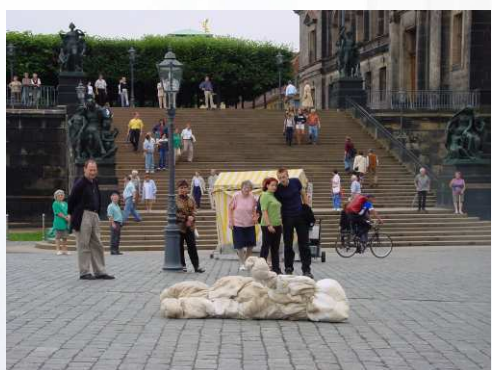
2001/06/29,30 ; 2001/07/2,3,5,7,8 德國 德勒斯登