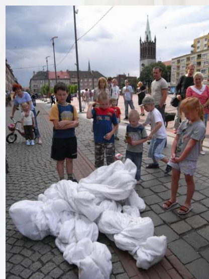
2008/07/08 波蘭 貝托姆市中心廣場