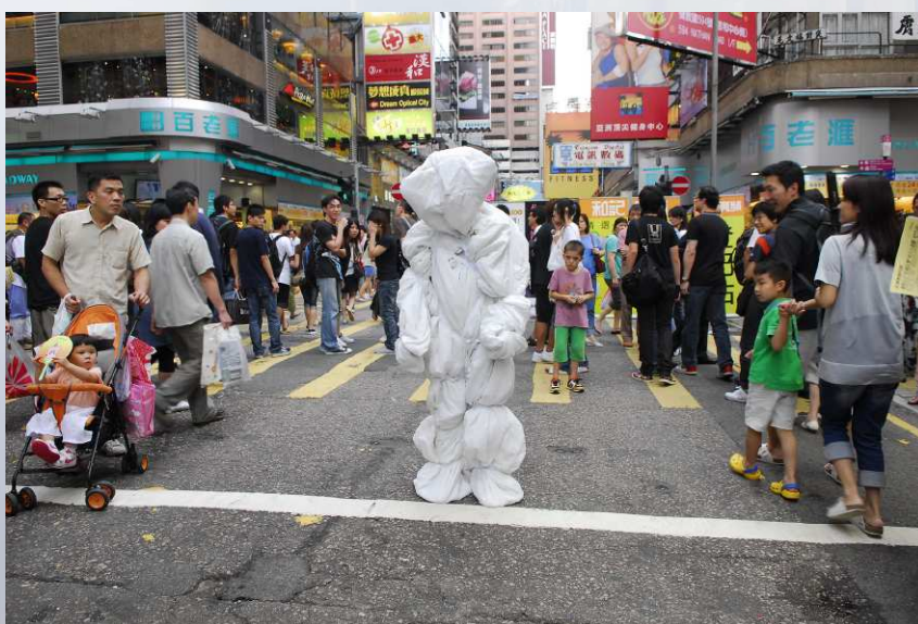
2008/06/15 香港 旺角 西洋菜街行人專用區