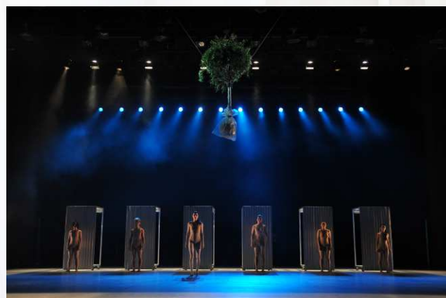
《昏迷二 - 尋找失去的感覺》2012年劇照