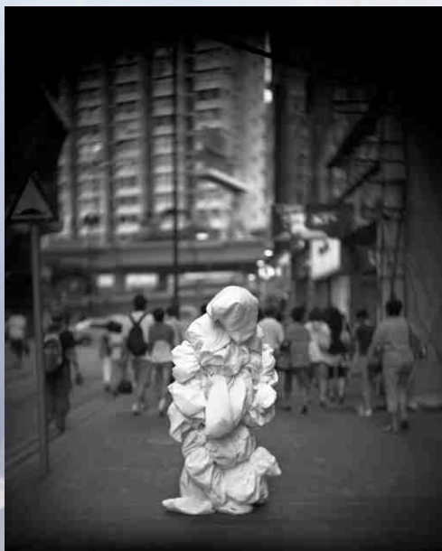
2008/06/21 香港 銅鑼灣 時代廣場