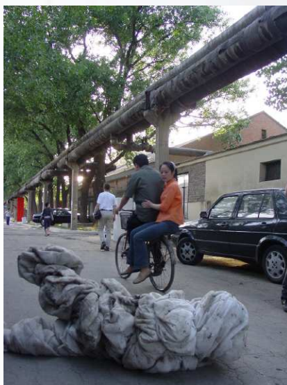
2005/05/1-3 中國 北京 大山子798藝術區